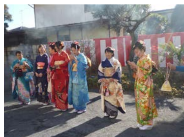
餅つき大会に着物で参加