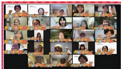
写真1 全体集合写真