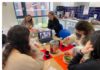
オンライン上で茶道の作法を学ぶ外国人参加者