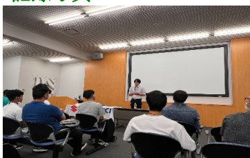
スズキ（株）の社員モンゴル出身との交流の様子