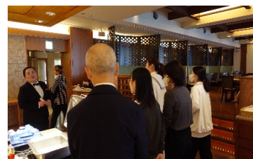
中国人の先輩社員による焼津グランドホテル内の案内と説明をしている様子