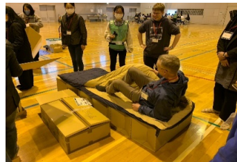
避難所での段ボールベッド体験