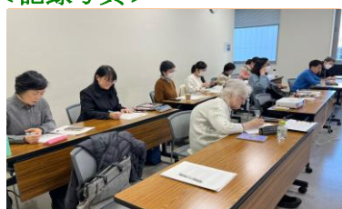
医療英語 及び医療関連の研修