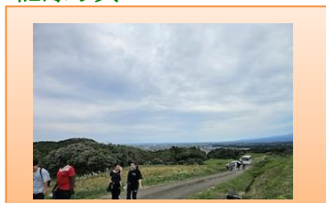
棚田・畑見学風景