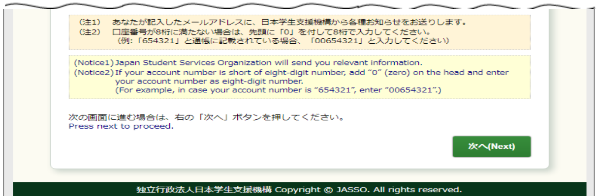
画面3-9(「4-cd. 振込口座登録 (学習奨励費)」画面)