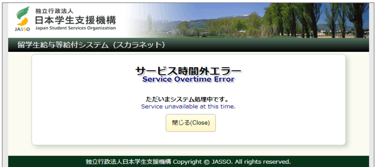
画面3-13(「E003. サービス時間外エラー」画面)