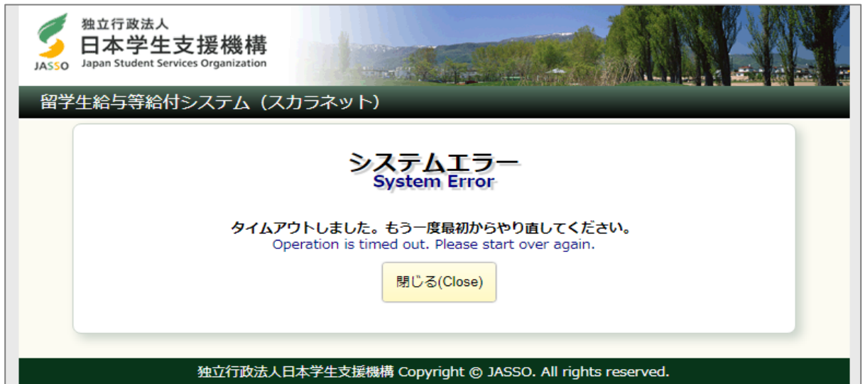
画面3-12(「E002. システムエラー」画面)