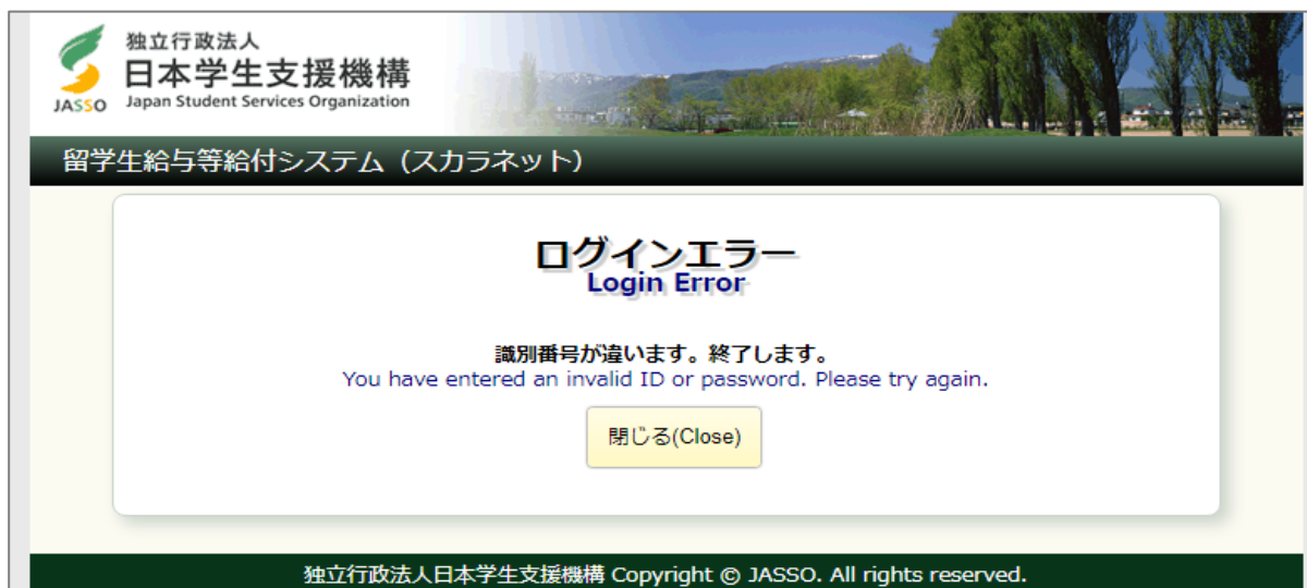
画面3-3 (「E001. ログインエラー」画面)

パスワード入力を連続して3回ミスした場合、エラーメッセージが表示されます。 パスワードを再確認して、もう一度やり直してください。