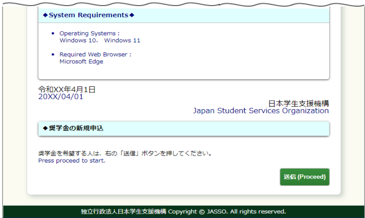
画面3-1(「振込口座届提出用(学生用)トップページ」画面)