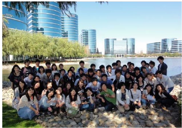
オラクル社の美しい建物を背景に SVEP/ALEP学生達

また、シリコンバレーのビジネスマンや研究者からの講話や、サンノゼ州立大の教授陣より、生物、情報、心理学などの分野の講義を聴く機会を作った。