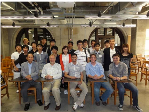
UCバークレーGlaeser 研究室の 皆さんと共にYREP学生達

(*) エレベーターピッチとはエレベーターに乗って降りるまでの1-2分の短い間に自分の言いたいことを伝える手法であり、シリコンバレーでは良く使われる。