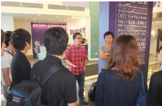
ヤフー中国人エンジニアから話を聞くSVEP学生達

毎週金曜日のフィールドトリップはSVEPとALEPでは異なる。SVEPのフィールドトリップは主として企業を中心としている。インテル展示館、アップルストア、ヤフー、ソフトウェア会社オラクル、インキュベーションセンターPlug and Play、半導体装置メーカー