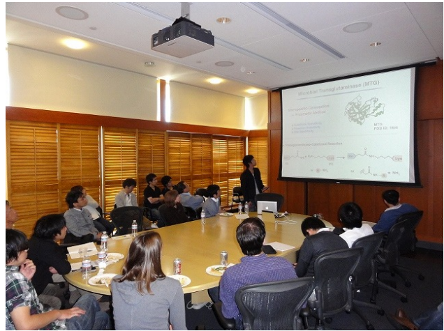
UCバークレーDoudna 研究室にて 発表するYREP学生達

それに加えて、毎週金曜日にはフィールドトリップを行い、参加者の専門分野に近い企業の研究所や大学を訪問し、国際的な研究発表の実践的な練習を行った。別名「海外武者修行」と呼ばれているゆえんである。2011年は化学系が中心だったので、UC Berkeley, IBM Almaden Research Center, Stanford University, San Jose State University などの化学・生物系の研究室を訪問し、訪問先の教授や研究者と交流し、参加者が各自の研究内容について英語でのプレゼンテーションを行った。それぞれに活発な質疑応答や意見交換が行われた。カリフォルニアオフィスではこれらプレゼンテーションに先立ち各人の個別発表練習会を催し、自信を持って発表が出来るよう指導している。この個別練習に使った時間は発表者12人に対して合計で30時間に達した。一方で、Plug and Play というインキュベーションセンターを見学し、ちょうど行われていたエレベーターピッチ的(*)な発表会を聞いて、科学や技術がビジネスに繋がる現場を身近に体験した。