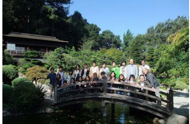
サラトガ市にある箱根ガーデンを訪問するALEP学生達

Novellus、そしてスタンフォード大学などを訪問した。一方、ALEPのフィールドトリップは農学に関連するところを選んだ。サラトガ市にある日本庭園「箱根ガーデン」を皮切りに、サンフランシスコの北にあるレッドウッドの森のMuir Woods、スタンフォード大学のJasper Ridge Biological Preservationやバイオの研究室、カリフォルニア大学デービス校農学部、サラダコスモ社のもやし製造の見学、そして最終日にはSVEPと合同でオラクルを訪問するなど多岐にわたった。世界を牽引するビジネス戦略やビジネスモデル、そして実際にシリコンバレーで働くビジネスマンから日本で働くこととの違いなどについて、生の声を聞くことが出来た。日本との違いを考えることは非常に大きなインパクトを与えたようであり、世界に通用する国際人としての第一歩を踏み出すきっかけとなったのではないかと感じている。