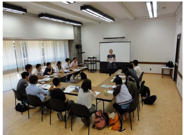
少人数でのプレゼンの授業を受ける SVEP/ALEP学生達

英語の授業はこの合計56人の学生を4つのレベルに分け、Presentation, Accent Training, Speaking and Listening, Campus Eventsの4種類の授業が、それぞれ専門の教師によって毎週18時間、4週間行われた。日本では教えられることの少ないプレゼンテーションの授業やアクセントの授業などは特に有益で、英語で話すことへの抵抗感がなくなり、これまでにない自信を身につけることが出来たようだ。