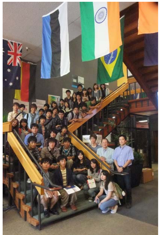
Plug & Play Tech Center を 見学するSVEP学生達