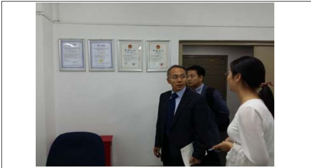
調査・指導/Inspection and advise

この研究指導事業によって詳しく研究と教育に指導を受けられ、今後の発展に大きな励みになると同時に大学間交流にも大いに役に立ったと思う。この機会を与えてくれた日本学生支援機構に感謝したいと思う。