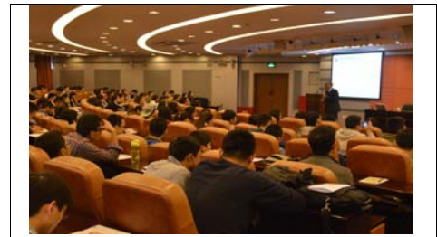
特別講義:「新エネルギー材料および環境浄化機能材料の研究開発について」 /Special lecture: 「Today and future trend on research and development of materials for new energy and environment - Thermoelectric and photocatalyst materials -」