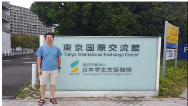
So happy to meet JASSO/JASSO を会ってうれしい