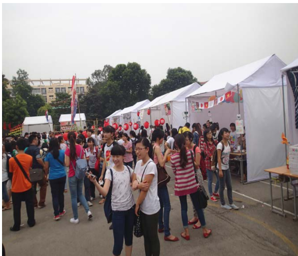
ハノイ大学日本語学部の学園祭の様子

一方、ハノイ大学は日本語教育に関して最も歴史の古い大学の1つであり、日本語教育は、1973年に英語学部および中国語学部の学生を対象に第二外国語として開始された。1993年には正規の学部昇格し、現在の日本語学部に至る。大学院教育に関しては2010年に修士課程が開設されている。ハノイ大学日本語学部の役割は、①日越通訳・翻訳の専門人材の育成、②日本語教師の育成、③ハノイ大学以外の学生を対象とした日本語短期コースの開講、④日本の大学・研究機関と提携した学生交換・文化交流の実施、⑤国内・国際シンポジウムの開催、⑥日越の協力関係の強化などがある。日本語学部の組織としては、日本語基礎学科、通訳翻訳学科、日本語学学科、日本文学文化学科、専門教育学科から構成されている。こうした点でハノイ大学の日本語学部は、