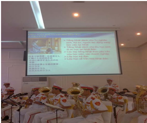
教育開発・人材開発学院の開学式

る予定（2014年現在、総合大学については設置計画中止）ということであった。ヴィンズオン省には多数の日系企業が進出しており、こうした日本との経済関係を重視した高等教育の改革は、地域の需要をくみ上げる取り組みの1つにもなっている。