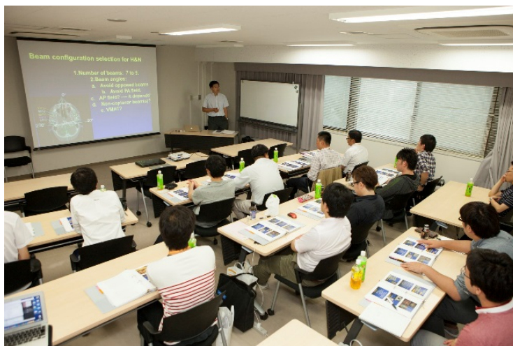
写真3 スタンフォード大学との医学物理サマースクール(8月)

今後の展望に関しては、本学は、本年度より、スーパーグローバル大学等事業の「スーパーグローバル大学創成支援」の助成により、先述の「北大近未来戦略 150」の中核となる実行計画として、「Hokkaido ユニバーサルキャンパス・イニシアチブ」（以下、「本構想」とする）を開始した。本構想は、総長のイニシアチブの下、本学を「世界に開かれ、世界と協働する大学へ」と徹底的に変革しつつ、世界の課題解決を牽引する人材を育成しようとの取り組みである。「ユニバーサル・キャンパス」というコンセプトの下、世界のあらゆる場所を教育研究の場として活用していくという方針を掲げ、ガバナンス