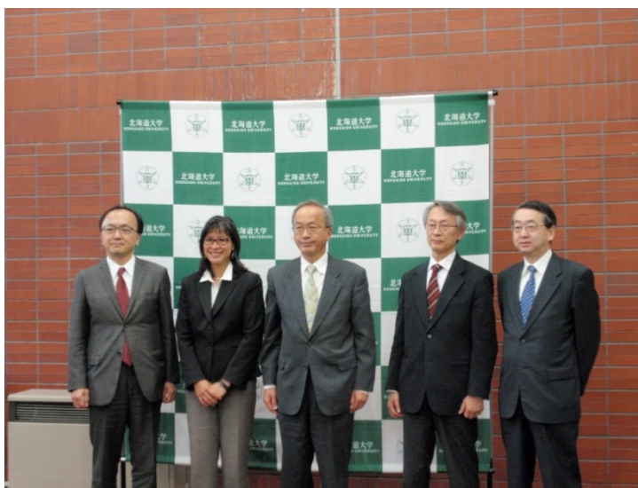
写真1 スタンフォード大学からのユニット誘致についての記者会見(4月)

また、人獣共通感染症GSについても、メルボルン大学、アイルランド国立大学ダブリン校、アブドラ国王科学技術大学(KAUST)から研究ユニットを誘致しているが、複数大学からの複数ユニット招致という特色を活かし、本学人獣共通感染症リサーチセン